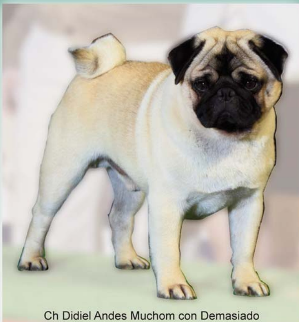
Ch Didiel Andes Muchom con Demasiado

C.A.C. de la Real Sociedad Canina de España