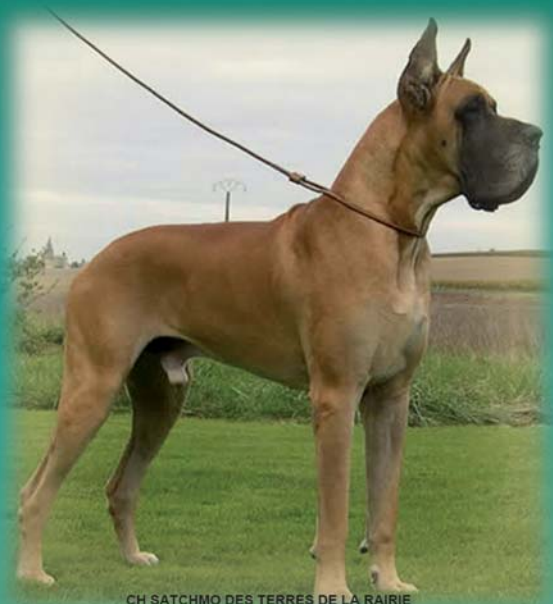
CH SATCHMO DES TERRES DE LA RAIRIE