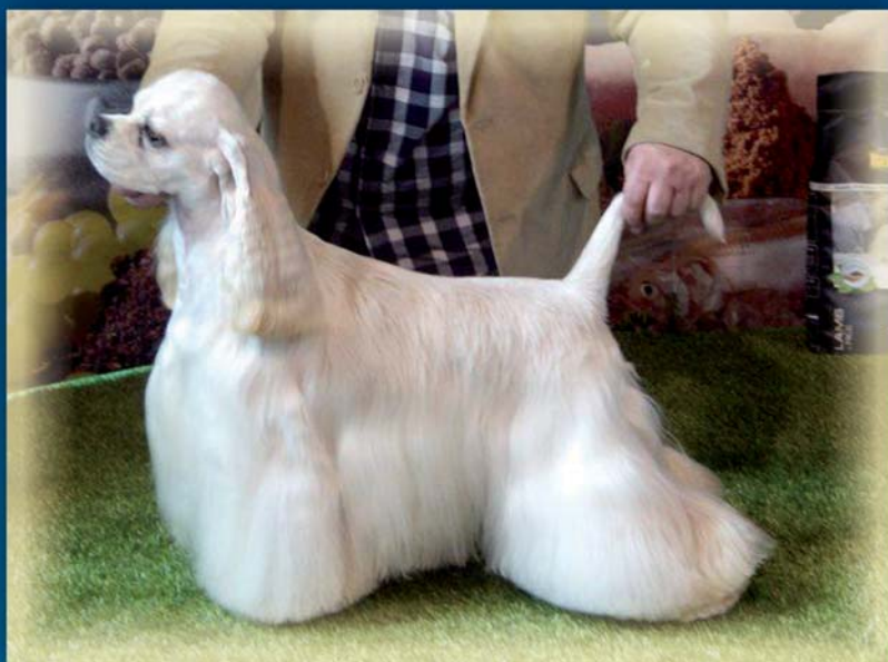
Garfi Mágico. B.I.S. Ciudad Real 2014

C.A.C. de la Real Sociedad Canina de España